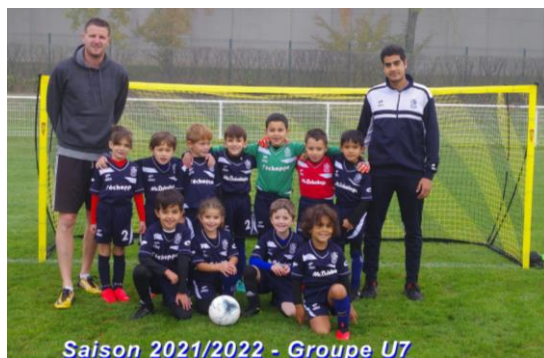
Saison 2021/2022 - Groupe U7

Cliquez sur ce lien pour voir le tutoriel de l'organisation et de l'animation d'un plateau U7 saison 2024-2025: