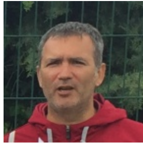
Cédric Barry Evènements