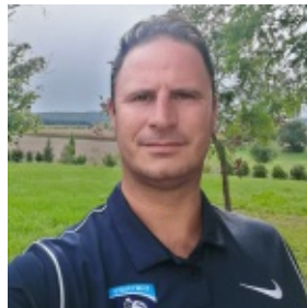
Gregory Herlemont Partenariats - Evènements