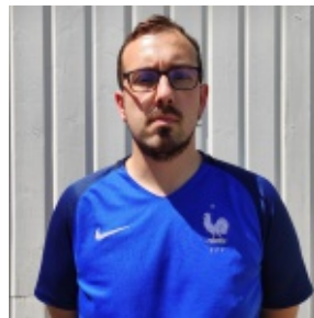
Nicolas Portillo Publications