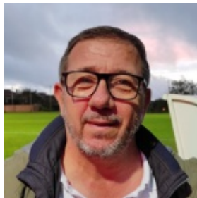
JF Chaussounet Evènements