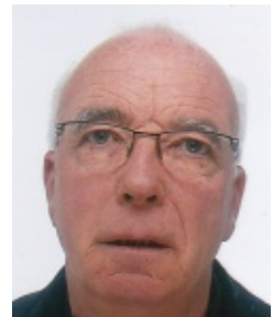
Bernard Mommeja Formations Clubs - Web